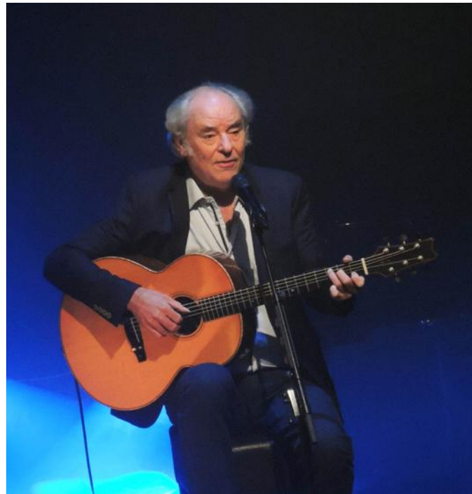
Maxime Le Forestier : amour et engagement.

cément bleus, éclairent un tabouret et une guitare acoustique. Maxime Le Forestier s'avance tranquillement et démarre San Francisco dans un silence recueilli. Tiré du même